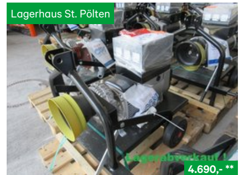
Hartner Zapfwellengenerator ZG IP23, 42kVA - 1.500U/min., Sonstige Kommunalgeräte NR. 19041059, 3107 St. Pölten Traisenpark, Tel. 0664/6271429, Vertr. Josef Grubmann