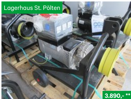
Hartner Zapfwellengenerator ZG IP23, 30kVA - 1.500 U/min., Sonstige Kommunalgeräte NR. 19041051, 3107 St. Pölten Traisenpark, Tel. 0664/6271429, Vertr. Josef Grubmann