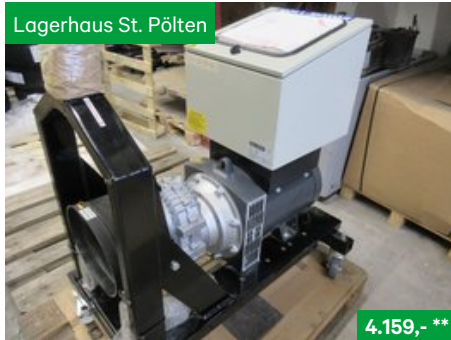
Hartner Zapfwellengenerator Moll ZGN-28/15 Haus undFeldbetrieb, Sonstige Kommunalgeräte NR. 19041060, 3107 St. Pölten Traisenpark, Tel. 0664/6271429, Vertr. Josef Grubmann