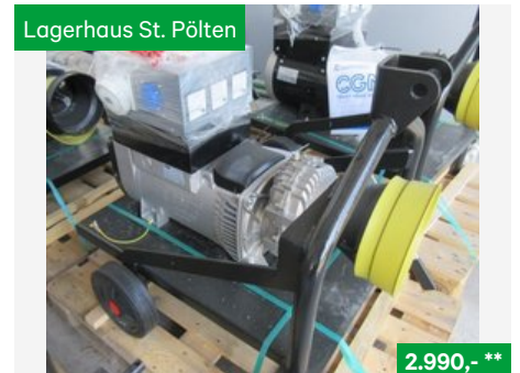
Hartner Zapfwellengenerator ZG IP23, 15kVA -1500U/min., Sonstige Kommunalgeräte NR. 19041058, 3107 St. Pölten Traisenpark, Tel. 0664/6271429, Vertr. Josef Grubmann