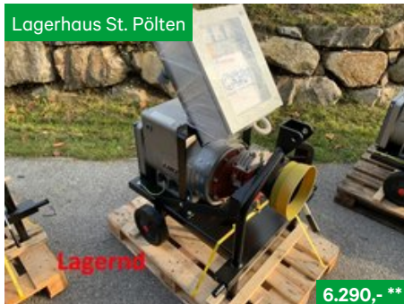
Hartner Zapfwellengenerator ZG 420/3 TR 1500U/min., Sonstige Kommunalgeräte NR. 19041035, 3107 St. Pölten Traisenpark, Tel. 0664/6271429, Vertr. Josef Grubmann