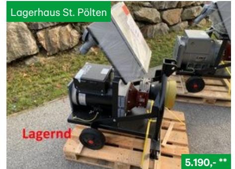
Hartner Zapfwellengenerator ZG 200/3 TR 1500 U/min., Sonstige Kommunalgeräte NR. 19041034, 3107 St. Pölten Traisenpark, Tel. 0664/6271429, Vertr. Josef Grubmann