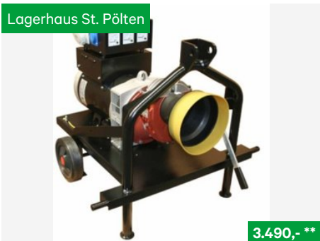
Hartner Zapfwellengenerator ZG IP23, 20kVA - 1.500U/min., Sonstige Kommunalgeräte NR. 19041048, 3107 St. Pölten Traisenpark, Tel. 0664/6271429, Vertr. Josef Grubmann